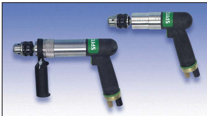
Abb.: Druckluft-Bohrmaschinen 2 1262 0010 / 2 1260 0010