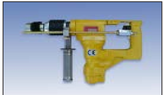
Abb.: Bohrhämmer (Hydraulik) 2 2406 0010

Zubehör : 2 2406 9010 Hydraulik-Schlauchsatz