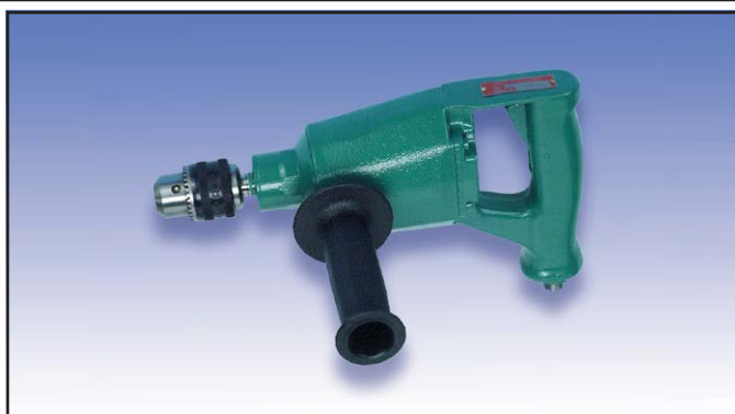
Abb.: Druckluft-Bohrmaschine 2 1310 0010 (mit Ventilklinke)