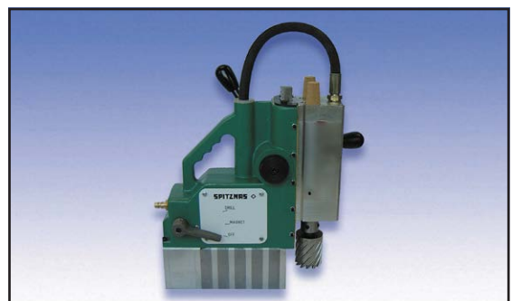
Abb.: Magnet-Kernloch Bohrmaschine (Druckluft) 2 1330 0010

Einsatz : Hoch-, Tiefbau Bauindustrie Off-Shore (Metallbau)