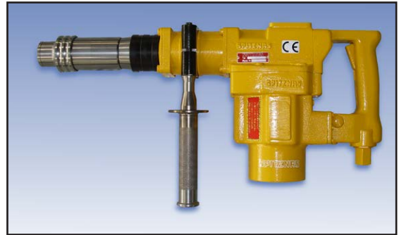
Abb.: Bohrhämmer (Druckluft) 2 2417 0010

Zubehör : 2 2406 9010 Hydraulik-Schlauchsatz