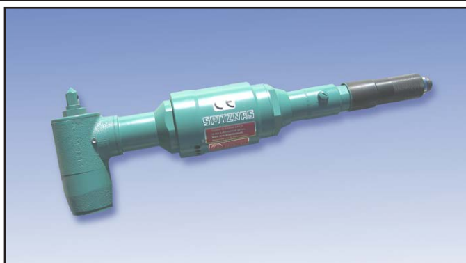
Abb.: Druckluft-Eckenbohrmaschine 2 1801 0030