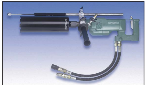
Abb.: Kernloch Bohrmaschine 2 1317 0030 mit Bohrkrone und Schläuche als Zubehör

Zubehör : 2 1317 9010 Hydraulik-Schlauchsatz